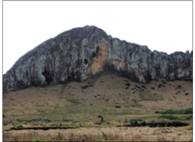
▼ Vulkan Rano Raraku.